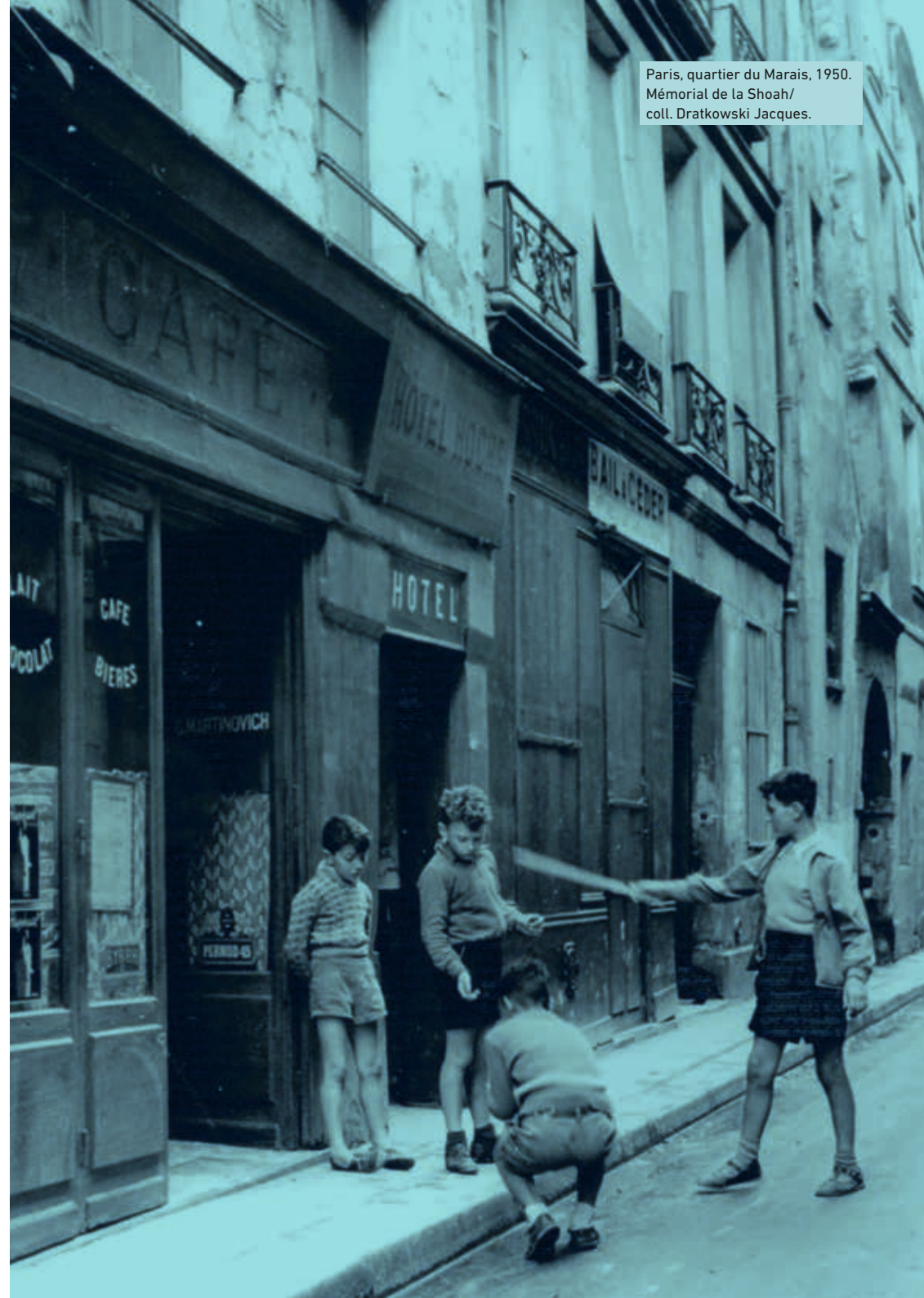
Paris, quartier du Marais, 1950.