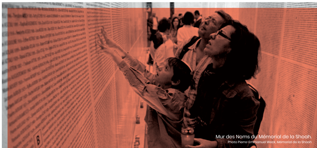
Mur des Noms du Mémorial de la Shoah.